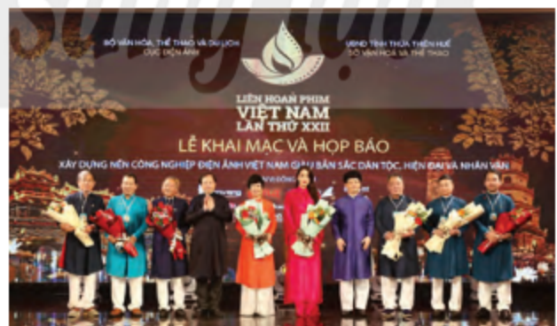
Hình 4. Liên hoan phim Việt Nam lần thứ 22 được khai mạc ở thành phố Huế