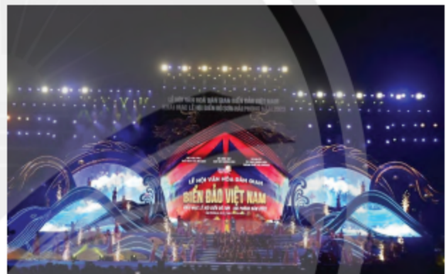
Hình 2. Lễ hội Văn hoá dân gian Biển đảo Việt Nam và Lễ hội Biển Đồ Sơn năm 2023