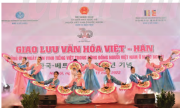
Hình 3. Tiết mục nghệ thuật được biểu diễn tại Chương trình “Giao lưu văn hóa Việt – Hàn”.