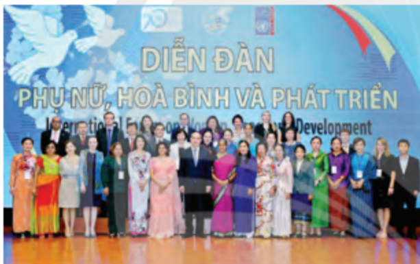
Hình 1. Các đại biểu dự Diễn đàn quốc tế “Phụ nữ, Hoà bình và Phát triển” Nguồn: Hội Liên hiệp Phụ nữ Việt Nam

Đi đôi với xu hướng toàn cầu hoá kinh tế, đạo đức, lối sống của người Việt có những thay đổi nhất định theo hướng tích cực. Sự mở rộng trong tầm nhìn và quan hệ xã hội khi mà người Việt và cộng đồng nơi họ sống trở nên mở lòng hơn với văn hoá và giá trị từ các quốc gia khác, biểu hiện qua số lượng người tham gia các hoạt động xã hội đa văn hoá và quốc tế. Sự tăng cường trong ý thức bảo vệ môi trường và phát triển bền vững khi mà người Việt bắt đầu quan tâm và tham gia hoạt động bảo vệ môi trường và sử dụng nguồn tài nguyên có trách nhiệm hơn, biểu hiện qua sự gia tăng trong việc tái chế và sử dụng nguồn năng lượng tái tạo.